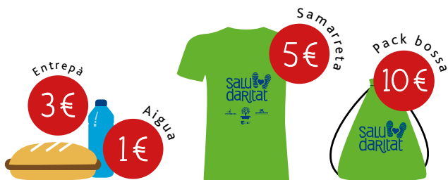
Foto de la saludaritat

Pack de samarreta, motxilla, entrepà, aigua, poma