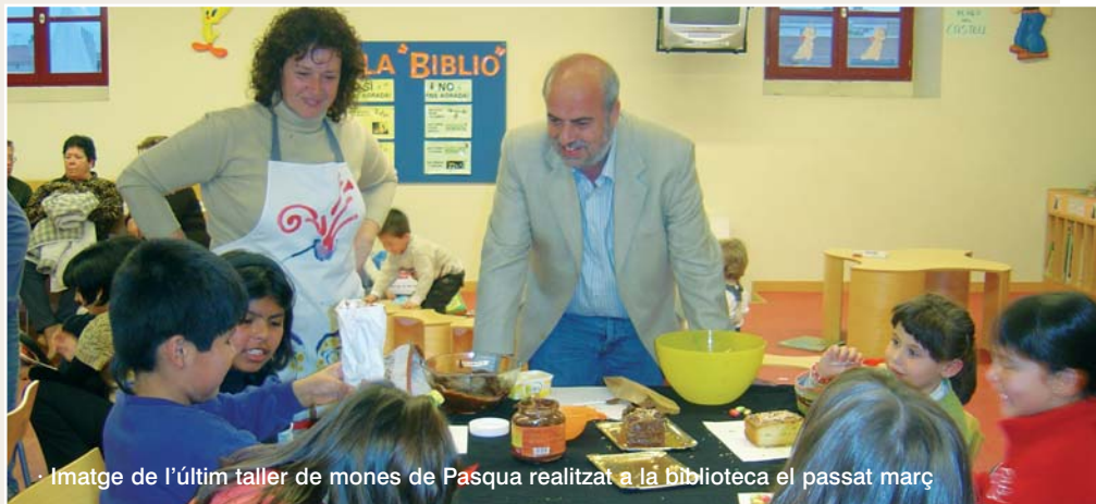
Imatge de l'últim taller de mones de Pasqua realitzat a la biblioteca el passat març

La biblioteca de Pallejà anuncia fins a 13 activitats diferents per als propers mesos