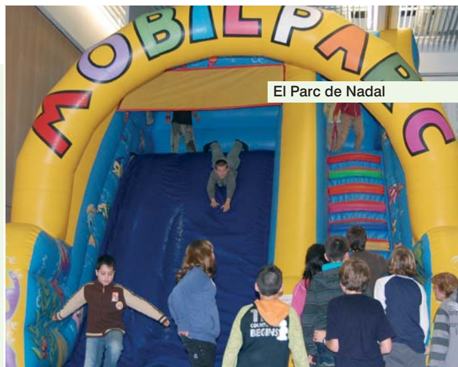
El Parc de Nadal

Com a tota celebració, la música i la festa també han tingut la seva presència durant les festes nadalenques. D'aquesta manera, el Taller de Música oferia el 20 de desembre un concert en el qual alumnes i professors van poder mostrar les seves habilitats, mentre que el 4 de gener els Amics de la Sardana organitzaven a la Sala Pal·ladius una actuació a càrrec de la Cobla Sabadell. D'altra banda, l'ambient festiu va tenir el seu punt culminant amb la celebració de les dues festes de Cap d'Any, que enguany s'estima que van aplegar més de 700 persones.