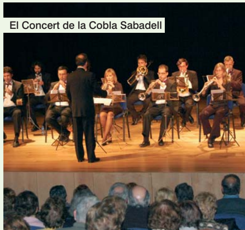
El Concert de la Cobla Sabadell