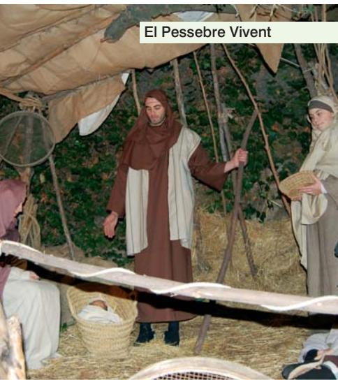
El Pessebre Vivent