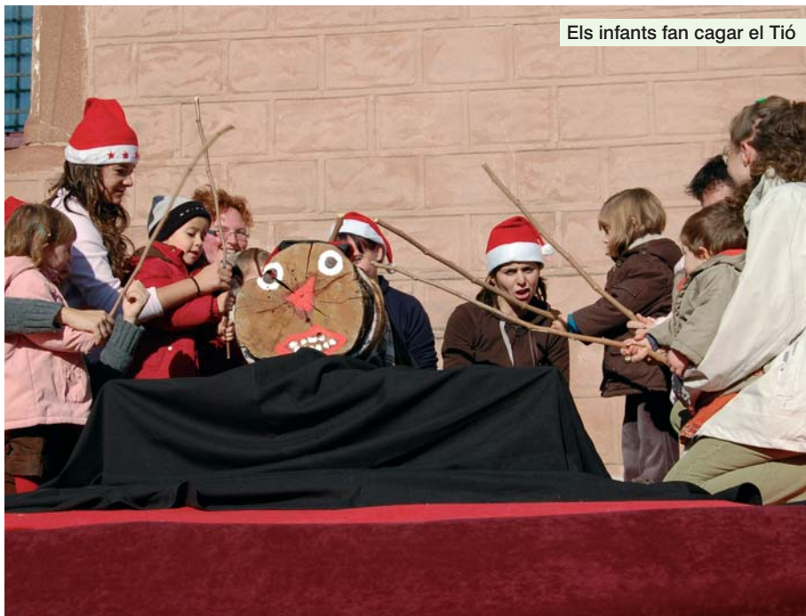
Els infants fan cagar el Tió