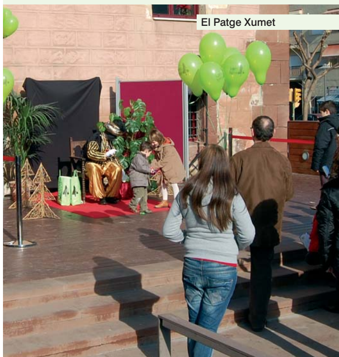
El Patge Xumet

Una vegada més, la celebració del programa d'actes de Nadal a la nostra vila ha esdevingut l'excusa perfecta per a posar de manifest l'alta participació dels veïns i veïnes en les propostes de caire tradicional, lúdic i social que s'organitzen a Pallejà. Els actes més tradicionals s'iniciaven el passat 4 de gener amb la visita del patge Xumet i seguien el 6 de gener amb les cantades dels infants del CEIP Jacint Verdaguer, que des de l'any 2005 han recuperat la tradició dels Nicolaus. Els nens i nenes van ser protagonistes en altres esdeveniments, com el "Caga, Tió", que va aplegar 500 infants a la plaça del Castell el 24 de desembre; el Racó del Conte a la biblioteca, on els Contents Contem Contes Cantant van explicar el conte de Nadal, o la visita del Pare Noel i el "Caga, Tió" que van tenir lloc al Centre Cívic de Fontpineda. En tot cas, el moment àlgid arribava el 5 de gener amb la vinguda dels Reis Mags de l'Orient. Ses Majestats van iniciar un recorregut a l'estació del tren que els va portar a la plaça del Castell, per diferents carrers del poble, i va finalitzar a la Sala Pal·ladius.